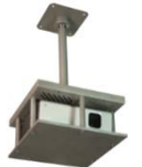
Artnr: 710 / 7204 / 7104

Tillval: 517-3 Likalås (ASSA), 517-2 H-Nyckelsystem (ASSA), 7592 Väggstativ - Grand