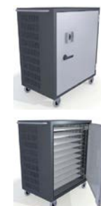
Artnr: 62844 / 62855

CEKA-AnchorPads unika lösning för säker förvaring, flyttning, laddning och synkronisering av Laptops, iPads/Surfplattor, Mini-Laptops. Vagnen finns i 2 versioner: Small som rymmer upp till 10st Laptops eller 20st iPads/Surfplattor/Mini-Laptops alternativt Large som rymmer 20st Laptops eller 30st iPads/Surfplattor/Mini-Laptops. Vagnen har en mycket säker och solid konstruktion i pulverlackerad stålplåt och är byggd med samma låsmekanism som klassade säkerhetsskåp är utrustade med. Finns i versioner med godkänt nyckellås av högsäkerhetstyp eller med avancerat och godkänt kodlås med många inställningsmöjligheter som är ett bra val om Ni är många användare . Som standard har vagnen 10st uttag (62844) alternativt 20st uttag (62855) men fler uttagslister finns som tillval. Väl tilltagna hål sörjer för god ventilation vid laddning. Som tillval finns Termostatstyrd fläkt (636) om man önskar ha datorerna i drift, exempelvis vid uppdateringar nattetid (fläkt behövs ej vid endast laddning). Specialhjul gör vagnen mycket lättmanövrerad. Som tillval finns tillbehör för förankring mot vägg eller kring annat fast föremål, monteringshylla för skrivare, portabel tröskelplåt som gör det enkelt att köra även över höga trösklar samt Ladd/Synkenhet eller Laddstation för iPads/Surfplattor. Mått utvändigt: (HxBxD): 1000x685x520 mm (Small) / 1000x910x520 mm (Large). För mer information och produktblad: Klicka på produktnamnet ovan.