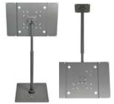
Artnr: 754 / 7551

Golvstativ: Artnr. 7551 (450-700mm) / 7552 (700-1230mm) / 7553 (1400-2520mm) / 756 Hjulsats / 7562 Breddningsplåt