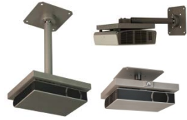
Artnr: 711 / 712 / 714

Vägg: Artnr. 7140 (220-260mm) / 714 (450-700mm) Micro: Artnr. 712 (65mm)